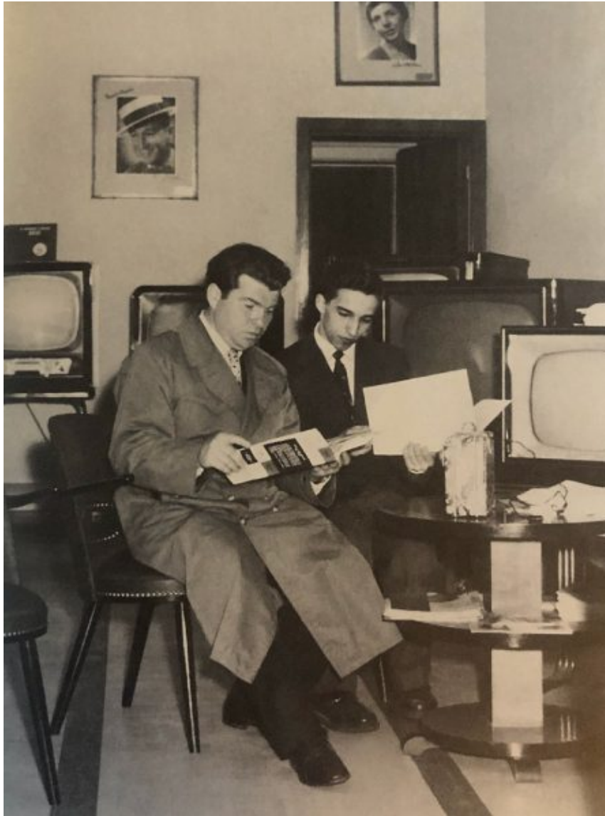
Vladimir Ashkenazy med Emil Gilels 1956

Finns det någon speciell konsert eller evenemang i er karriär som ni minns särskilt mycket?